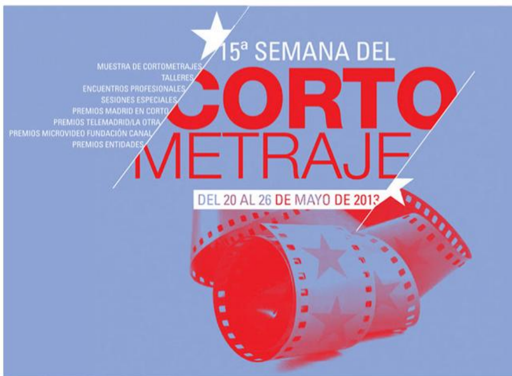
Cartel de la 15ª Semana del Cortometraje de la Comunidad de Madrid